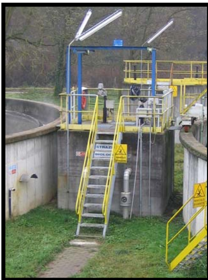
7 Ripartitore reflui