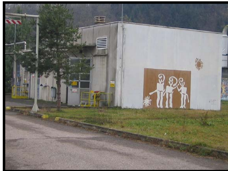
22 Locale quadri