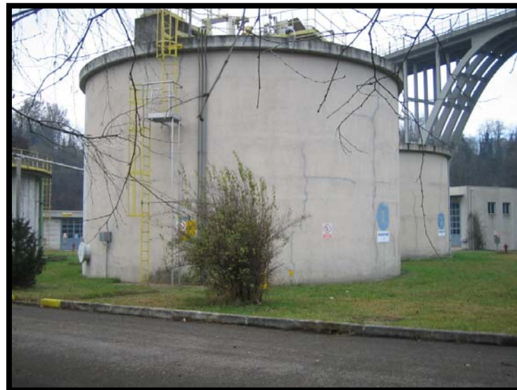
18 Post-digestore anaerobico