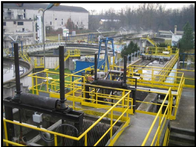
1 Vista d'insieme