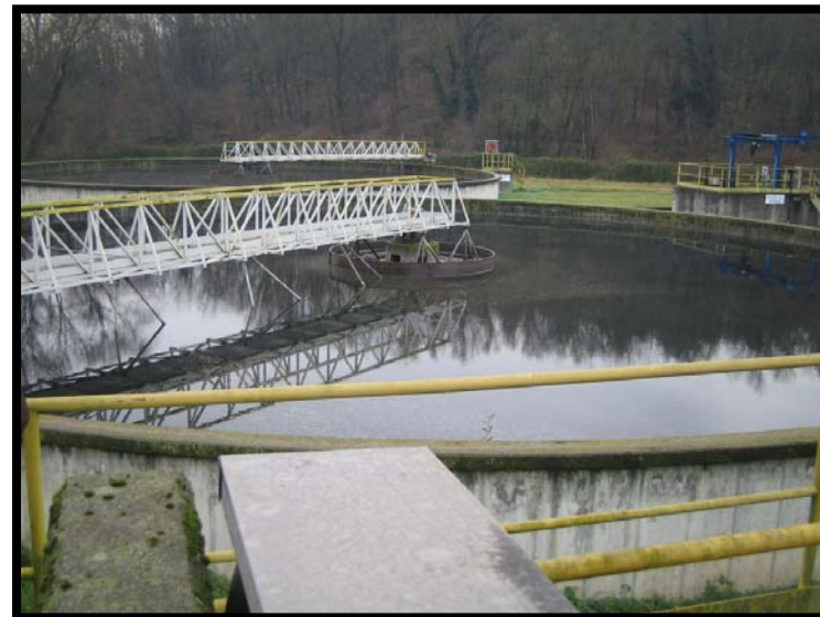
10 Sedimentazione secondaria