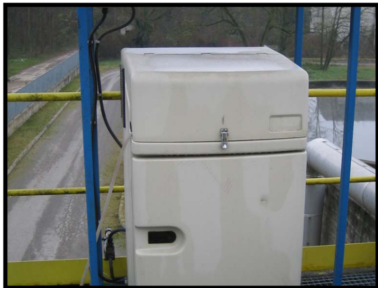
3 Campionatore automatico in ingresso