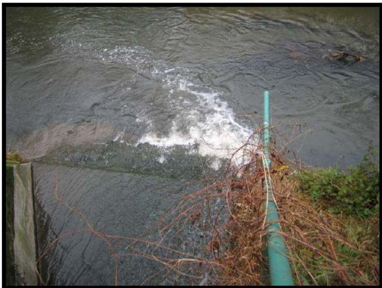
15 Punto di scarico nel fiume Olona