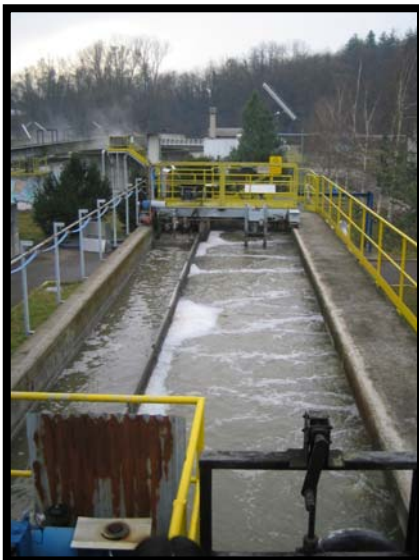
5 Dissabbiatura e disoleazione