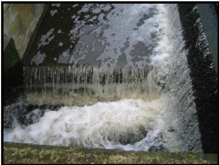
13 Scarico refluo trattato