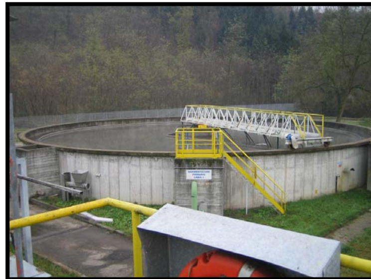
6 Sedimentazione primaria