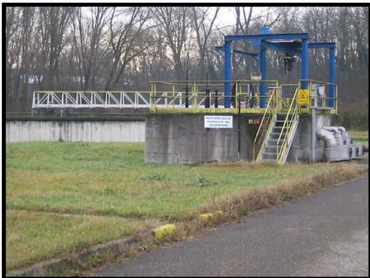
11 Ricircolo fanghi