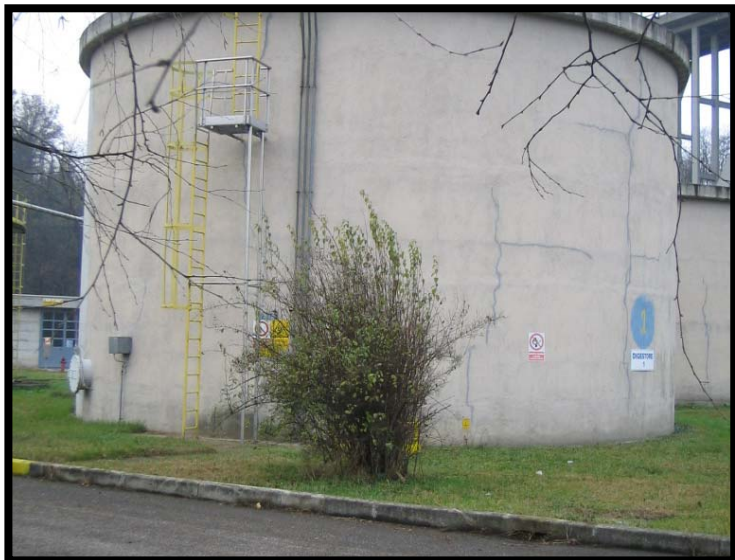
17 Digestore anaerobico