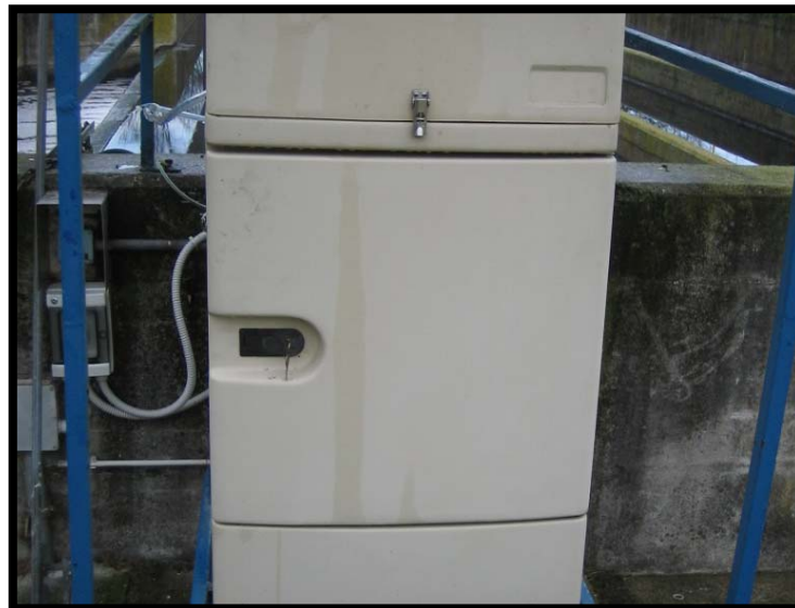
14 Campionatore automatico in uscita