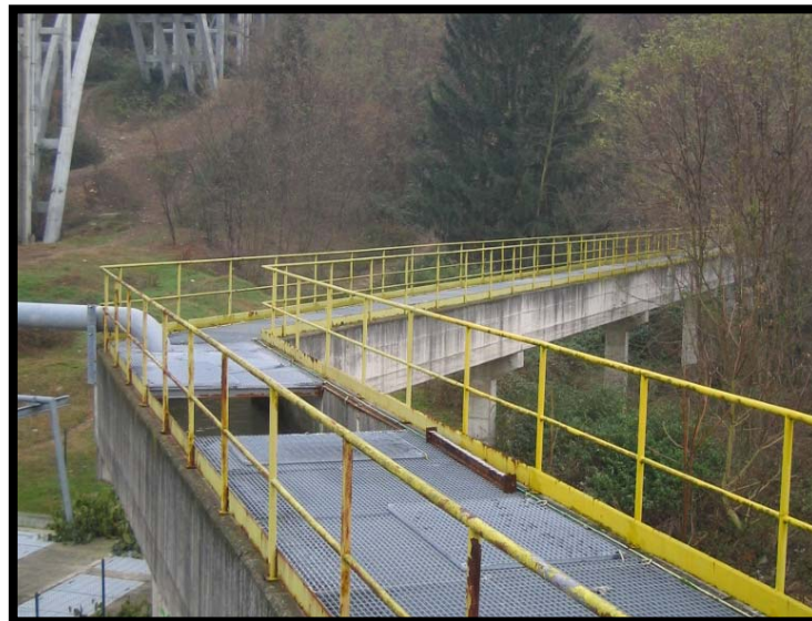
2 Arrivo liquami